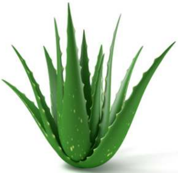
Aloe Vera Barbadensis Miller